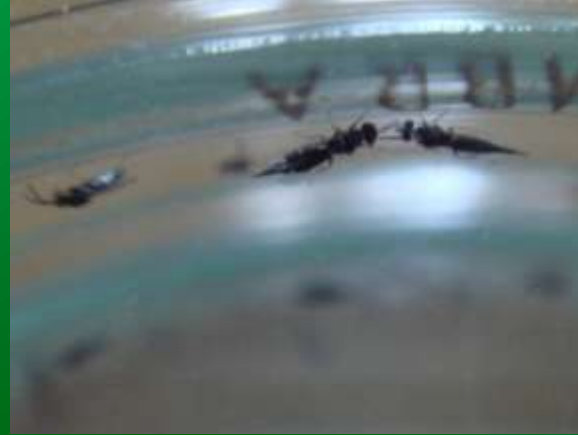
Имаго Tetrastichus sp. в лаборатории перед выпуском в очаг Ag.planipennis в МО (лаборатория ВНИИЛМ)