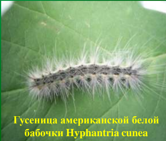
Гусеница американской белой бабочки Gyrus sordidus