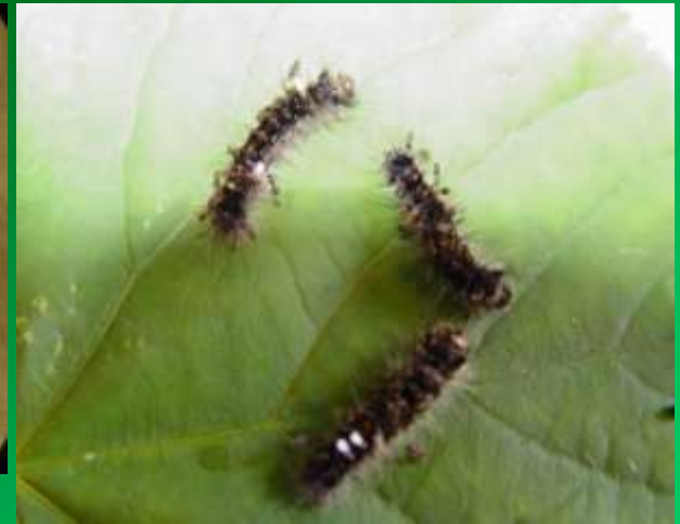
Имаго Ch. sinea заражают гусениц непарного шелкопряда (лаборатория ВНИИЛМ)