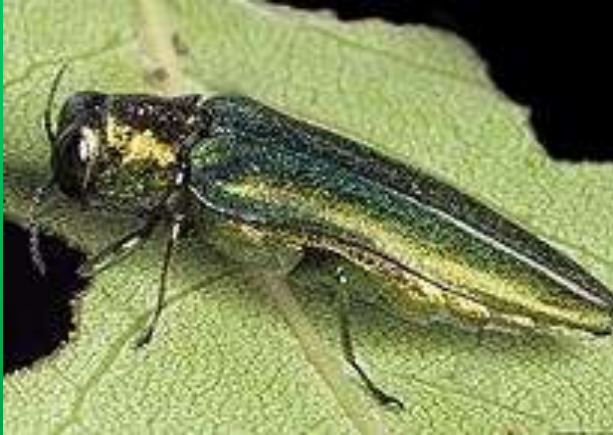
Имаго ясеневой изумрудной узкотелой златки Agrilus planipennis