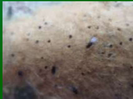
Имаго яйцееда Ooencyrtus caryana на кладке непарного шелкопряда