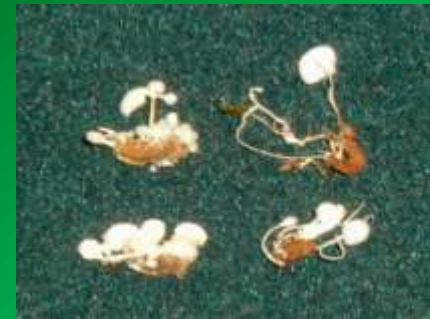
Личинки звездчатого пилильщика-ткача, пораженные энтомопатогенным грибом Paecilomyces farinosus