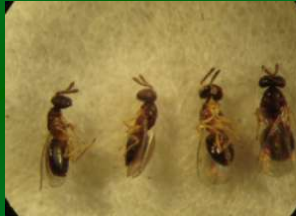
Chouioia sinea – новый эффективный паразитоид для ограничения численности американской белой бабочки