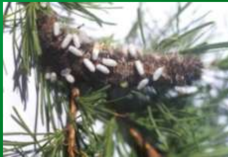
Гусеница сибирского коконопряда, зараженная наездниками рода Aranantes

➤ Разработать современную концепцию комплексной биологической защиты леса, определяющую функциональные границы биометода и основанную на применении разных средств биометода в зависимости от состояния древостоев, популяций вредных организмов и социально-экономических последствий.